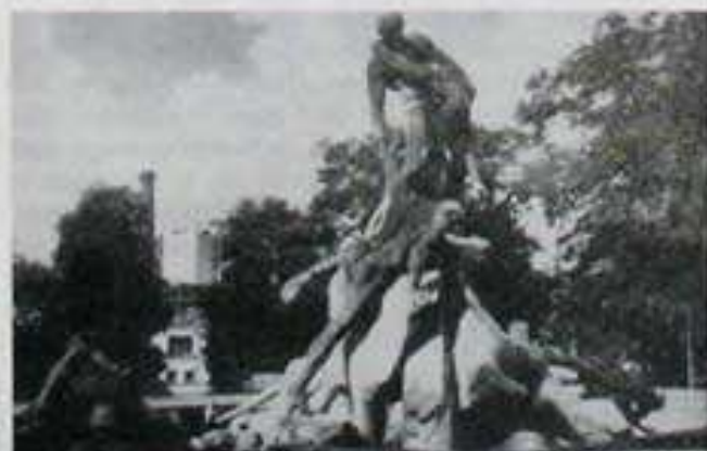
„Im Regierungsgarten in Bromberg befindet sich der Sintflutbrunnen. Menschen und Tiere suchen der immer höher steigenden Flut zu entrinnen. Aber ermattet sinken die meisten nieder. Nur ein Mann hat die höchste Felspitze erreicht, seine erschöpfte Frau auf dem einen Arm tragend, an dem anderen den alten Vater nach sich ziehend. Aber bald wird die Felspitze auch über-