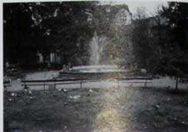
Seit 61 Jahren erinnert dieses leere Bassin an den 1943 aus kriegsbedingten Gründen zerstörten Sintflutbrunnen. Doch man ist zuversichtlich, daß dieser Brunnen in absehbarer Zeit wieder errichtet wird.

Und weiter ist in dem von Katarzyna Staszak verfaßten Artikel zu lesen, daß der Sintflutbrunnen schnell die Herzen der Bromberger eroberte. Er war eine Visitenkarte der Stadt. Die Journalistin zitiert weiter Zbigniew Ra-