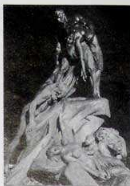
Der Bromberger Sintflutbrunnen war ein beliebtes Motiv für Fotoaufnahmen. Auf dem Bild links ist die Mutter von Lilly Wiese, Duderstadt, im Jahre 1925 zu sehen.

so viel des künstlerisch Vollendeten und wirkt dadurch in so hohem Maße künstlerisch erziehend, daß die Mängel reichlich aufgewogen werden. Dem Staate gebührt für dieses wohlwollende Geschenk unser uneingeschränkter Dank.