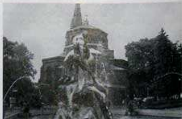
spült sein. Nicht auf ihr ist die Rettung zu finden, sondern nur auf dem Hügel, der das Kreuz Christi trägt. – Neben dem Sintflutbrunnen steht die evangelische Paulskirche. Auf ihrer Turmspitze ragt ein Kreuz.“

Aus: Homiletische Monatshefte 1935, Nr. 5, Pfarrer Friedrich Just, Siemno, Kreis Bromberg.