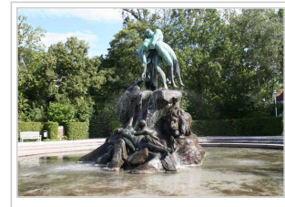
Sintflutbrunnen in Coburg