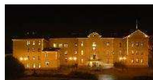
Budynek ratusza nocą