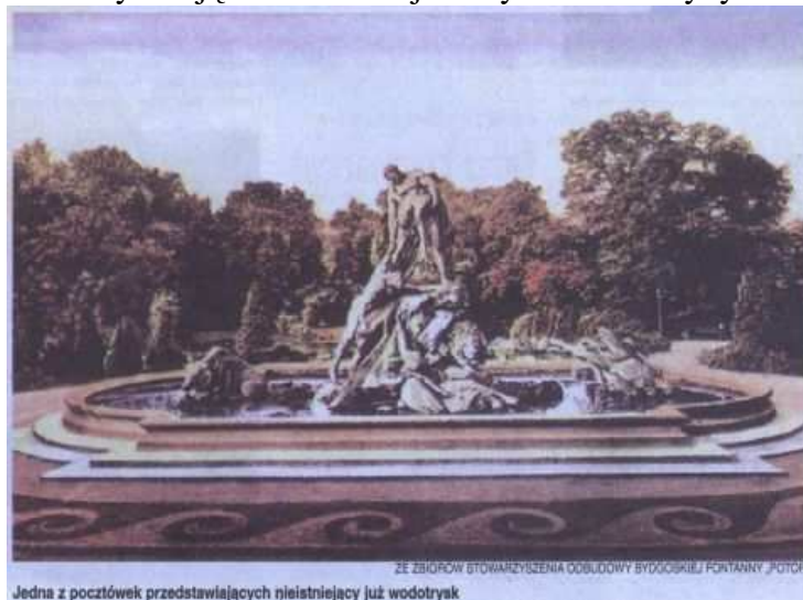
Jedna z pocztówek przedstawiających nieistniejący już wodotrysk

Rzeźbę odsłonięto w lipcu 1904 roku na dzisiejszym placu Wolności (wówczas Weltzienplatz). Fontanna przedstawiała sceny z biblijnego potopu - grupę ludzi i zwierząt, ratujących się przed wodą. Monument miał 6 metrów wysokości. Był wykonany głównie z brązu, który w 1943 roku został przetopiony na cele militarne. Ściany basenu fontanny zbudowane były z czerwonego piaskowca, a stopnie z szarego granitu. Należy dodać, że basen nie został zniszczony. Stoją w nim dzisiaj cztery kamienne ryby.