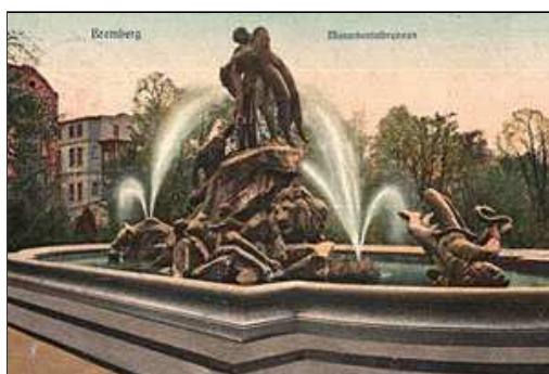
„Potop” na pocztówce sprzed stu lat bardzo różni się od miejsca, które możemy zobaczyć dziś w parku Kazimierza Wielkiego

Prawdziwą perełką jest „Studzienka” na Starym Rynku, która zachowała się w pierwotnej postaci, choć nie w pierwotnym miejscu (początkowo stała tam, gdzie obecnie pomnik Walki i Męczeństwa). Miejskich fontann ubywa. Prywatny inwestor, budując nowe kamienice, rozebrał wodotrysk przy ulicy Mostowej. Podobny los spotkał fontannę sprzed „Rywala” przy ulicy Gdańskiej. Z drugiej strony, niektórzy deweloperzy budujący w Bydgoszczy nowe budynki w ich otoczeniu umieszczają wodotryski. Tak stało się przy ulicy Emilii Plater i Wyczółkowskiego. Miasto koncentruje się raczej na utrzymaniu urządzeń, które jeszcze zostały - siedmiu fontann stacjonarnych i czterech pływających (po dwie na Balatonie i na starym Kanale Bydgoskim). Niedawno został ogłoszony przetarg na trzyletnie utrzymanie fontann w Bydgoszczy. Ratusz może na ten cel przeznaczyć 70 tysięcy złotych. - Zgłosiło się dwóch oferentów, którzy jednak zaproponowali ceny przewyższające nasze możliwości. Być może, będzie możliwe przesunięcie środków w