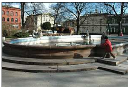
Los nie obszedł się łaskawie z bydgoskimi fontannami.

Oazy spokoju i zieleni, ulubione miejsca spotkań i do pamiątkowych fotografii. „Miaśnotwórcza” rola fontann była nie do przecenienia. Dzisiejsze wodotryski to w większości pamiątki po budownictwie socjalistycznym. Fontanny na placu Teatralnym, w parku im. Witosa, przed budynkiem NOT przy ul. Jagiellońskiej, w parku na Wzgórzu Dąbrowskiego, a także na skwerze Komedy naprzeciw filharmonii są raczej toporne w formie.