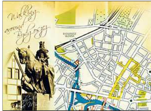
„Spacerownik...”, wydany przez TMMB, ukazuje różne oblicza Bydgoszczy

Takie wydawnictwo ukazuje się po raz pierwszy w powojennej historii Bydgoszczy. „Spacerownik bydgoski” to składana plansza z planem części miasta oraz opisem dwóch tras. Pierwszą nazwano „Bydgoskie Stare Miasto” i zawiera ona takie miejsca jak: Stary Rynek, katedra, ulica Długa, jest też kilka obiektów nieistniejących (synagoga, Teatr Miejski, fontanna „Potop”). Druga marszruta, nazwana „Bydgoszcz belle époque”, ukazuje inne oblicze miasta -