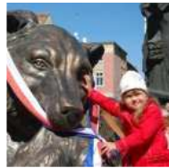
Autor: Maciej Kulesza Niedźwiedzica "Potopu" trafiła w ręce mi ...

Dziś, 19 kwietnia, w 663. rocznicę urodzin Bydgoszczy "Niedźwiedzica z niedźwiadkiem" oficjalnie stała się własnością miasta.