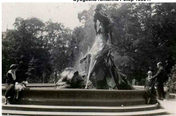
Bydgoska fontanna Potop 1930 r.

Koszt modernizacji ocenia się na 1,5 miliona złotych. Część środków pochodzi z budżetu ratusza, a ponad połowa inwestycji zostanie pokryta z funduszy Regionalnego Programu Operacyjnego. Pierwsze efekty mają już być widoczne pod koniec pierwszego kwartału 2010 r. Projekt zakłada również utrzymanie okolicy fontanny w staromiejskim stylu, dzięki czemu zamiast asfaltu ujrzymy mozaikę z kostki bazaltowej, staną stylowe lampy w parku i zostanie przebudowany odcinek ścieżki łączący plac Wolności z ul. Piotra Skargi.