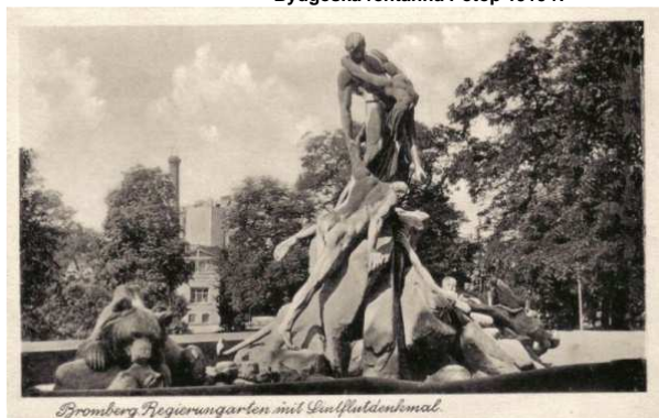
Bydgoska fontanna Potop 1919 r.

Głównym prekursorem powrotu tej pięknej rzeźby do parku Kazimierza Wielkiego jest Stowarzyszenie Odbudowy Fontanny Potop. Od kwietnia bieżącego roku przed Galerią Drukarnia możemy już podziwiać pierwszą rzeźbę - niedźwiedź, do której za kilka miesięcy w nowym miejscu ma dołączyć rzeźba: człowiek walczący z morskim wężem.