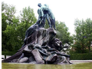
Kopia bydgoskiej fontanny w Coburgu (Baw...

Po wieloletnich staraniach Stowarzyszenia Odbudowy Fontanny Potop doczekaliśmy się wreszcie rozpoczęcia procesu rewitalizacji fontanny. Prace ruszyły w środę.