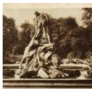
Autor: Fontanna-rzeźba Potop

Na 22 grudnia wyznaczono termin oddania do użytku fontanny „Potop” w Bydgoszczy.