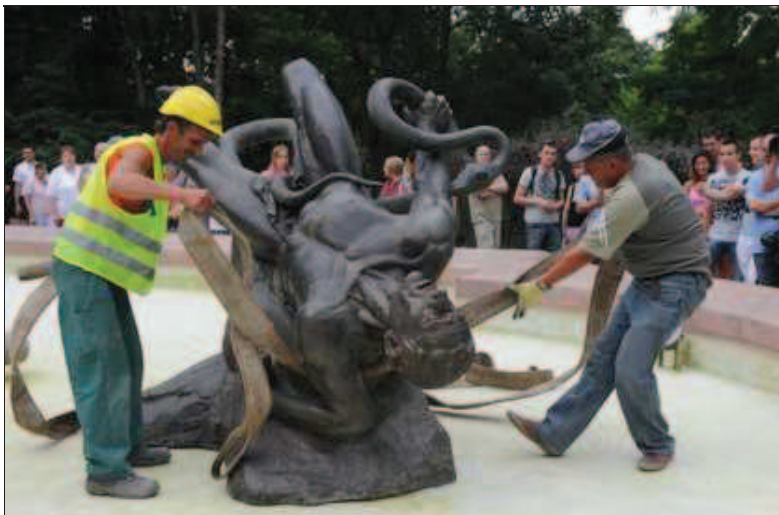
Stowarzyszenie Odbudowy Bydgoskiej Fontanny Potop, które w parku Kazimierza Wielkiego stawiało latem kolejne elementy zabytkowego wodotrysku, teraz nie będzie już mogło liczyć na wsparcie finansowe podatników